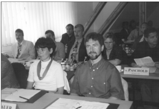
Gespannt verfolgten die Mitglieder der Vertreterversammlung die Rede des KZV-Vorsitzenden

Auch die Thüringer Zahnärzte blieben nach den Worten des Vorsitzenden von Unterstellungen und Verleumdungen nicht verschont. So hatte die Barmer-Ersatzkasse behauptet, mehr als die Hälfte der Abrechnungen sei falsch. „Der Grund für das multimediale Lamentieren der Krankenkassen ist nur zu klar: Sie haben bei der Behandlung der Patienten mit Zahnersatz nicht mehr mitzubestimmen. Sie haben ihre Macht verloren.“ Von rund 80 Beispielen mit angeblich falschen Abrechnungen, die der VdAK vorgelegt hatte, hätten nur wenige Fälle wirklich Anlaß zu Beanstandungen gegeben. Insgesamt sei dies für die Kolleginnen und Kollegen in Thüringen eine ebenso unangenehme Situation wie in ganz Deutschland gewesen. Öffentlich als „Betrüger“ oder „Abzocker“ diffamiert zu werden, gefalle niemandem. Teilweise hätten die Kolleginnen und Kollegen Stellungnahmen der zahnärztlichen Berufsverbände vermißt. So mancher habe sich auch darüber beschwert, daß er von seiner