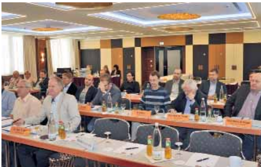
Kreisstellenvorsitzende und deren Vertreter

Die Kreisstelle Neuhaus am Rennweg hatte um Auflösung als Kreisstelle zum 1. Januar 2016 gebeten. Die Kreisstellen Sonneberg, Saalfeld und Rudolstadt hatten als Aufnehmende dagegen keine Einwände. Für die Region Artern wurde eine neue Gutachterin für den Bereich Prothetik berufen. Für die Amtsdauer vom 01.01.2016 bis 31.12.2017 wurden zahnärztliche Sachverständige für die Prüfungsstelle und für den Beschwer-