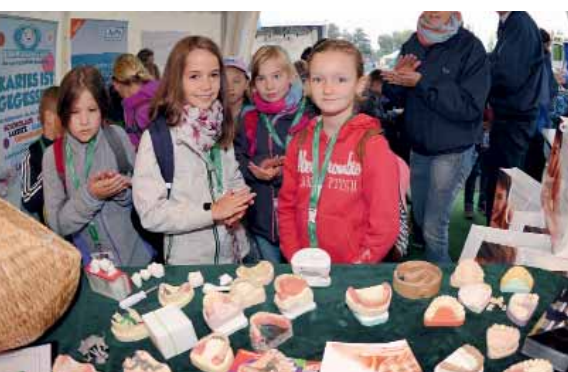
Am Stand des Zahntechnik Zentrums Eisenach konnten die Kinder u. a. Flummis aus Dental-silikon herstellen. Auch das Kinderschminken und der Zauberer waren stark nachgefragt.

Bereits eine Stunde vor der offiziellen Öffnung der Landgartenschau griffen 649 Schulkinder mit ihren 77 Lehrern und Betreuern aus Schmalkalden und Umgebung gespannt nach den Laufkarten, um sich ihren Besuch der zwölf Aktionsstände abstempeln zu lassen. Insgesamt besuchten 2.676 Gäste den diesjährigen Tag der Zahngesundheit.