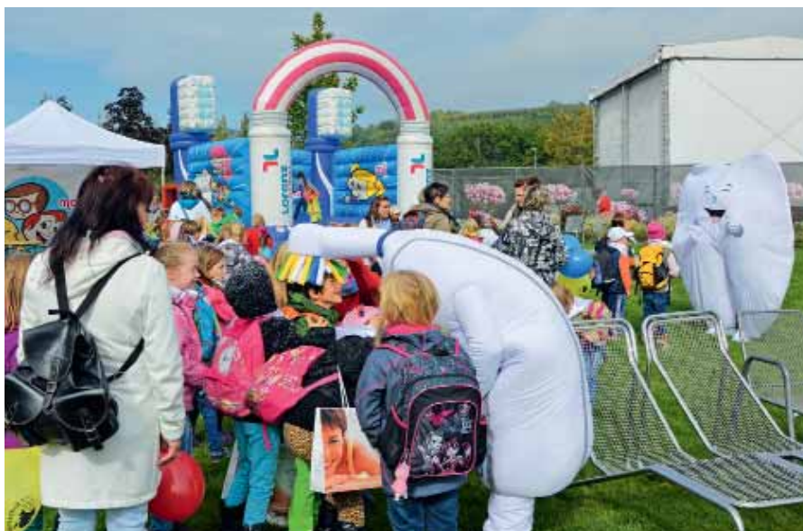
Vor der Hüpfburg, der Bastelstraße und dem Glückrad von Lorenz Dental und mimamo mussten Zahn und Zahnbürste viele Hände schütteln und über unzählige Köpfe bürsten.