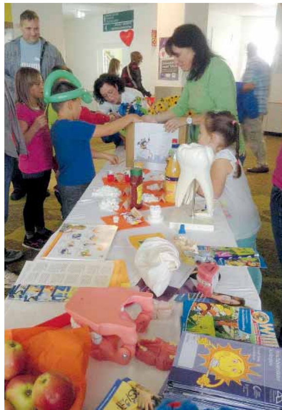
Informationen für Groß und Klein

Eltern konnten sich einen umfassenden Überblick über neue Kinderbücher zum Thema „Schnuller“, „Zahnspange“ und „Zahnputzgeschichten“ verschaffen. Anhand von Zahn- und Gebissmodellen wurden Besonderheiten beim Milchgebiss und besonders beim Durchbruch des 6-Jahr-Molaren vermittelt. Tipps und Tricks gab es auch für Eltern, deren Kindern das Zähneputzen nicht so leicht fällt.