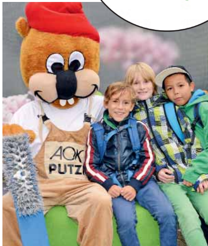
Erinnerungsfoto mit Maskottchen „Putzi“ am Stand der AOK Plus