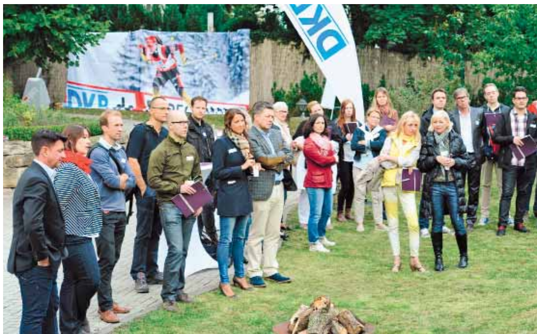
Interessierte junge Zahnmediziner

Die lockere Atmosphäre wurde durch den Ehrengast Nils Schumann abgerundet, der mit seinem Olympiasieg im Jahr 2000 und mächtig viel Motivation im Gepäck die Teilnehmer dazu ermutigte, an eigene Grenzen zu gehen und Tipps zur Eigenmotivation verriet.