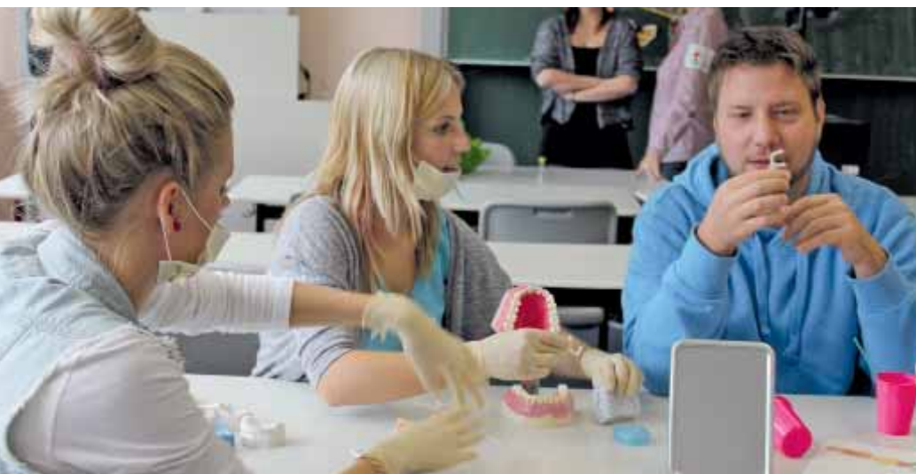
Die ZFA-Auszubildenden zeigten Tipps zur Anwendung von Zahnseide und demonstrierten das richtige Zähneputzen.