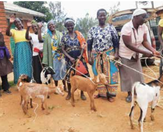
Ausgabe von Ziegen in Kenia

Bereits vor der Corona-Krise lebten 36 Prozent der Bevölkerung unterhalb der Armutsgrenze.