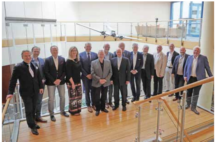
Die Teilnehmenden vor einem Modell der legendären „Tante Ju“

Der nächste Tagesordnungspunkt beinhaltete die Ergebnisse einer Arbeitstagung der Aufsichtsbehörden zu den Vergütungen hauptamtlicher KZV-Vorstände und die sogenannte Trendlinie, die für die kommende Legislaturperiode relevant sind. Dazu hatte sich dankeswerterweise Herr Kollege