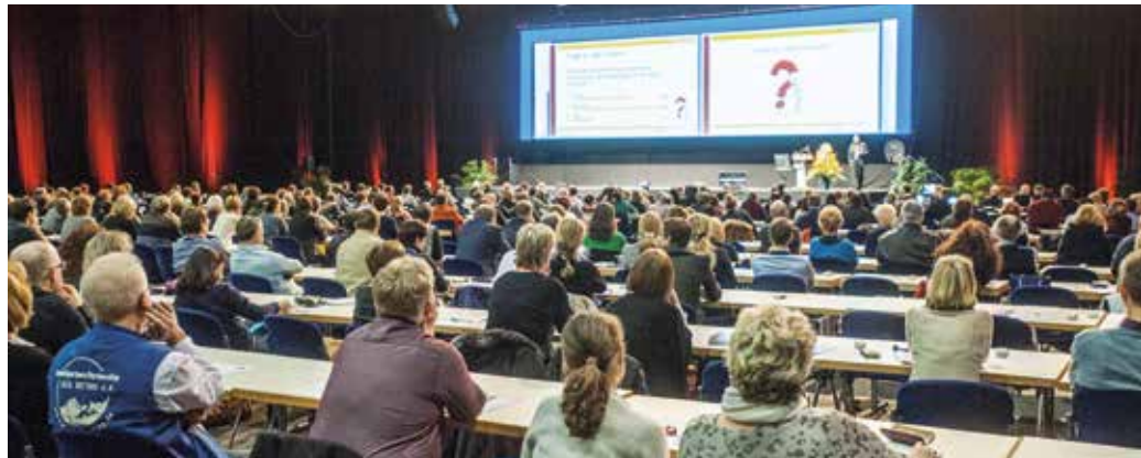
Nach vierjähriger Pause lockt der Thüringer Zahnärztetag am 25. und 26. November 2022 wieder die gesamte zahnmedizinische Gemeinschaft Thüringens auf die Erfurter Messe.

Mit der seit 1. Juli 2021 geltenden neuen PAR-Richtlinie haben wir im BEMA eine auf moderner Zahnmedizin beruhende Behandlungsgrundlage. Hier soll unser Zahnärztetag praxisnahe Anregungen und Hilfestellungen zur fachlichen Umsetzung geben. Der Kongress bietet dabei die Gelegenheit, sich intensiv mit den verschiedensten Aspekten einer Parodontaltherapie zu beschäftigen: Fachlich, organisatorisch und betriebswirtschaftlich.