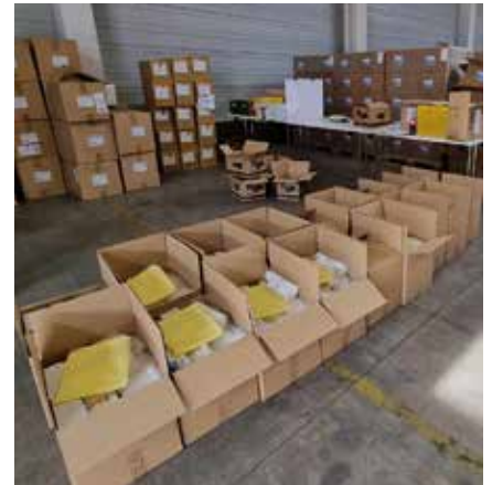
Teile der gepackten Schutzausrüstung

Nach Abschluss sämtlicher Vorbereitungen starteten am 10. Mai 2022 die ersten neun hochmotivierten KZV-Mitarbeiter/-innen mit dem Verpacken der Kartons in Weimar. Das bedeutete eine logistische Herausforderung für die Mitarbeiter/-innen, welche hiermit noch nie in Berührung kamen. Spätestens beim Betreten der Lagerhalle wurde jedem bewusst, welche Mengen es zu bewältigen gab. Vom zeitlichen Aspekt gesehen, schien es schier unmöglich, die einzeln verpackten FFP2-Masken für jede Praxis abzuzählen, sodass der Gedanke aufkam, diese abzuwie-