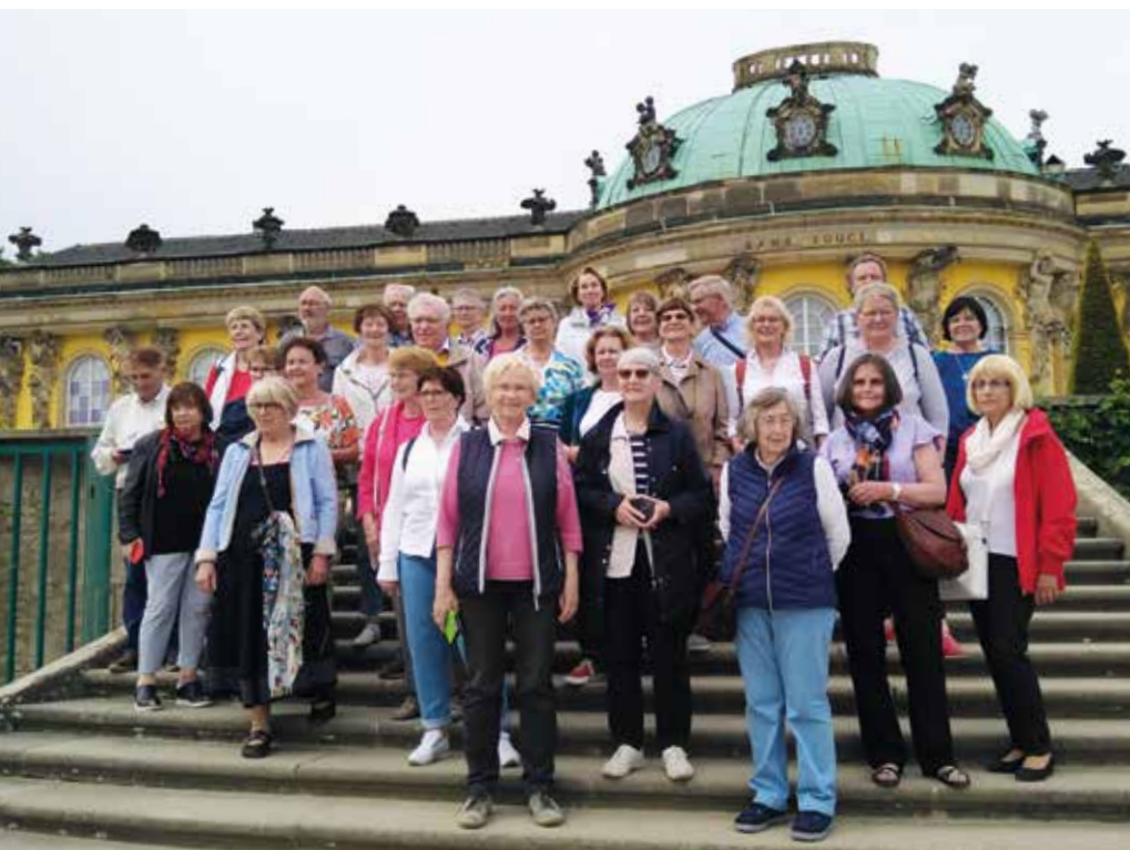
Auf den weltberühmten Stufen der einzigartigen Terrassenanlagen vor Schloss Sanssouci: Die Seniorinnen und Senioren der Thüringer Zahnärzteschaft in Potsdam