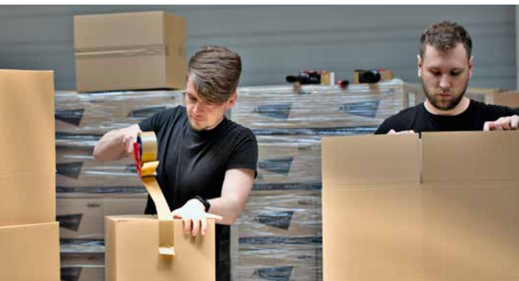
Fleißig wurden drei volle Tage die Pakete bestückt