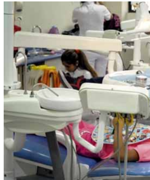
Behandlung in der Universität, die für viele Kinder ohne

Nach einigem Hin und Her gehen die ersten Kinder mit den Zahnärzten zur Behandlung. Wir Betreuer bleiben mit den restlichen Kindern draußen und spielen. Doch die Ruhe dauert nicht