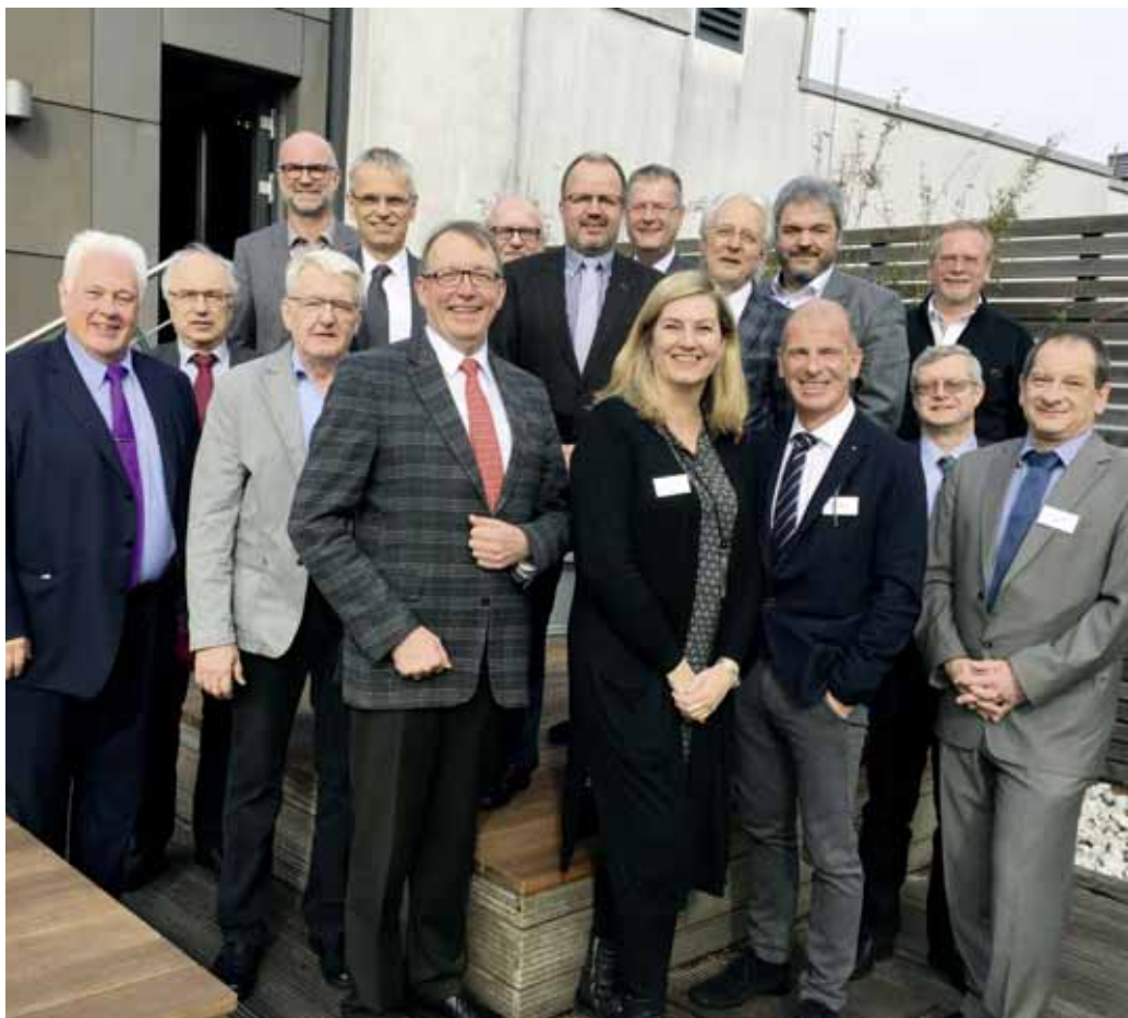
Die Vorsitzenden der KZV-Vertreterversammlungen

Am nächsten Morgen sprachen die Tagungsteilnehmer dann über die erfolgten Wahlen der hauptamtlichen KZV-Vorsitzenden. Der Umstand, dass die Aufsichtsbehörde deren Arbeitsverträge vorab genehmigen muss, führt in einigen KZVen dazu, dass Vorstände noch ohne wirksame Verträge im Amt sind. Drei KZVen lassen den neuen Vorstand bereits durch die alte Vertreterversammlung wählen und erhalten so mehr zeitlichen Vorlauf zum Beginn der neuen Amtszeit. Die übrigen Vertreterversammlungen wählen den Vorstand erst in der neuen Zusammensetzung, sind so aber in einem sehr engen Zeitfenster gebunden. Die beiden Vorgehensweisen wurden sehr kontrovers diskutiert. Ebenso wurde die Risikoabsicherung der VV-Vorsitzenden durch eine D&O - Versicherung, eine Art Amtshaftpflichtversicherung, thematisiert. Während in Bremen eine solche Versicherung für alle VV-Mitglieder besteht, gibt es in anderen KZVen nur teilweise