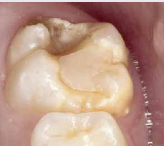
Abb. 7: Teilverlust einer Kompositfüllung an einem MIH-Molaren 6 Monate nach Füllungslegung