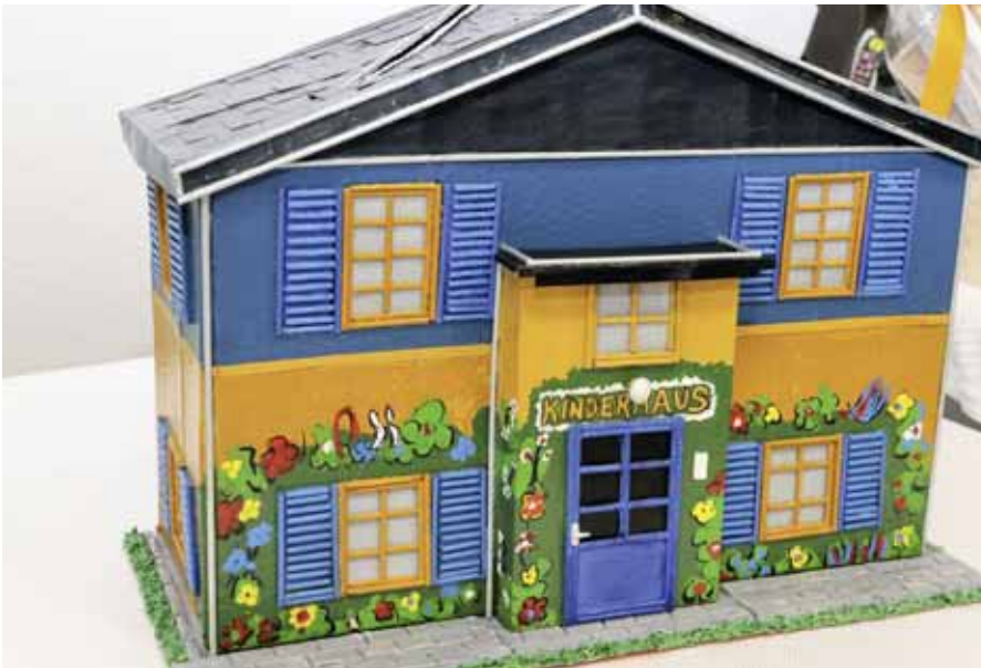
Die Spendenbox für das Kinderhaus Weimar