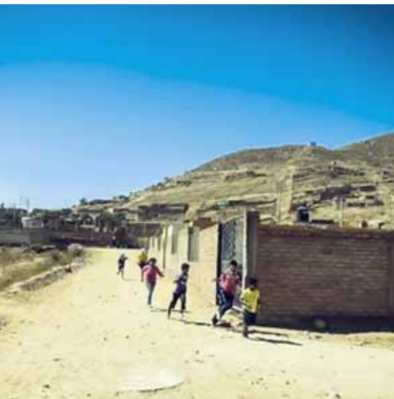
Einsatzort von Intiwawa: Slums der peruanischen Großstadt Arequipa

Mit einer Zusage für ein Hilfsprojekt in Peru landete ich Anfang September 2015 in Arequipa, einer 800.000 Einwohner zählenden Stadt im Hochland Perus. Nie zuvor hatte ich von dieser Stadt gehört. Hier wurde ich ein ganzes Jahr zum Mitarbeiter einer deutsch-peruanischen Einrichtung mit dem schönen Namen „Intiwawa – Ninos del Sol“ („Kinder der Sonne“), welche seit 2007 besteht.