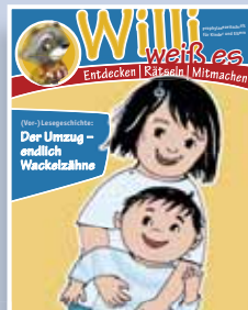
Heft 1 Thema: Wackelzähne

Prophylaxezeitschrift für Kinder und Eltern zum Verschenken an die kleinen Patienten. Themen rund um Gesundheit, Zähne und Zahnarztbesuche informieren die Kleinen auf kindgerechte Weise. Mit illustrierter Geschichte, Wissens-, Rätsel- und Elternseite.