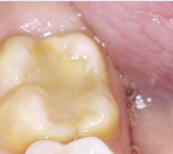
Abb. 6: Versorgung eines Molaren mit Schweregrad 2 mit einer Kompositfüllung