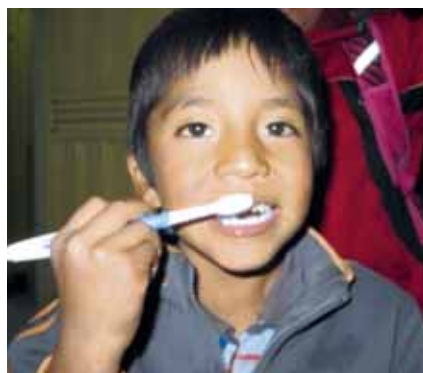
Tägliches Zähneputzen im Hilfsprojekt