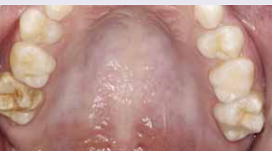
Abb. 1: MIH an den Zähnen 16 und 26 in unterschiedlicher Ausprägung

Der Begriff MIH beschreibt einen qualitativen Schmelzdefekt, bei welchem ein verringert mineralisierter, anorganischer Schmelzanteil zu Verfärbungen und Schmelzabbrüchen bei den betroffenen Zähnen führen kann. Klassischerweise wurde das Krankheitsbild für die ersten bleibenden Molaren und die Inzisiven definiert (Abb. 1 und 2). 1