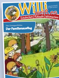
Heft 2 Thema: Zahnärztliche Prophylaxe