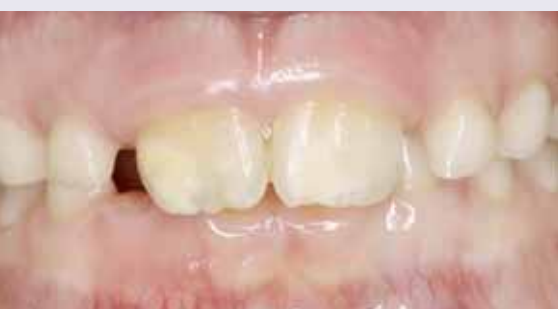
Abb. 2: MIH an den Frontzähnen 11 und 21

Die MIH tritt bei Kindern weltweit auf, wobei die Angaben zur Prävalenz in der Literatur schwanken. Berichtet wird von Häufigkeiten zwischen 3,6 und 44 Prozent. 2 In den nordischen Ländern wird das Auftreten mit 10 bis 19 Prozent angegeben. In Österreich leiden im Durchschnitt 4 bis 14 Prozent an MIH. In Deutschland reichen die Prävalenzangaben von 5,6 bis 14,7 Prozent. Nach der aktuellen DMS V-Studie weisen sogar 28,7 Prozent eine begrenzte Opazität auf. 3-8 Damit ist die Erkrankung inzwischen weiter verbreitet als die Karies. Auch ist der MIH-Mittelwert von durchschnittlich 0,8 Zähnen bei jedem Kind höher als der DMFT-Mittelwert.