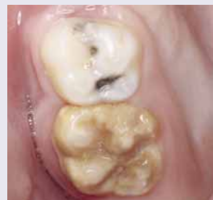
Abb. 5: MIH-Schweregrad 3