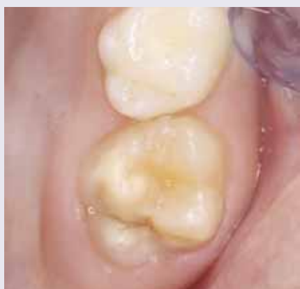
Abb. 3: MIH-Schweregrad 1

Eine strukturierte Zusammenfassung des Therapieplans basierend auf dem MIH-TNI wurde vor Kurzem in der Zeitschrift „Oralprophylaxe und Kinderzahnheilkunde“ veröffentlicht (Ausgabe 4/2016). 21,22