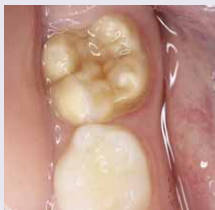
Abb. 4: MIH-Schweregrad 2