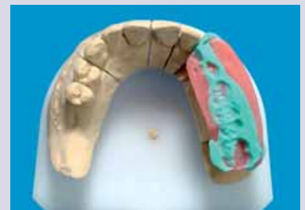
Abb. 9 und 10: Teilregistrat aus Beauty- Pink-Wachs/Futar-Okklusion mit Erfas- sung der präparierten Stümpfe und auf dem Meistermodell