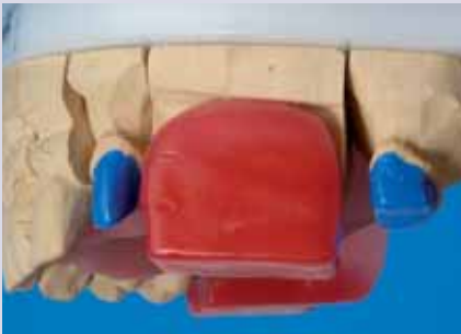
Abb. 16 und 17: Die auf einem Situationsmodell hergestellte Basisplatte (Abb. 16) passt schon aufgrund der unterschiedlichen Modellextension nicht auf dem Meistermodell (Abb. 17)