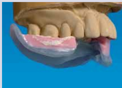
Abb. 18 – 21: Die Registrierschablone aus lichthärtendem Laborkomposite und Wachswall liegt der Schleimhaut auf und stützt sich auf den Zähnen 43 und 44 sowie auf dem Implantat regio 33 ab. Es wurde mit einer ZnO-Eugenolpaste nachregistriert. Abb. 20 zeigt die Schablone von basal mit dem einpolymerisierten Retentionszapfen.