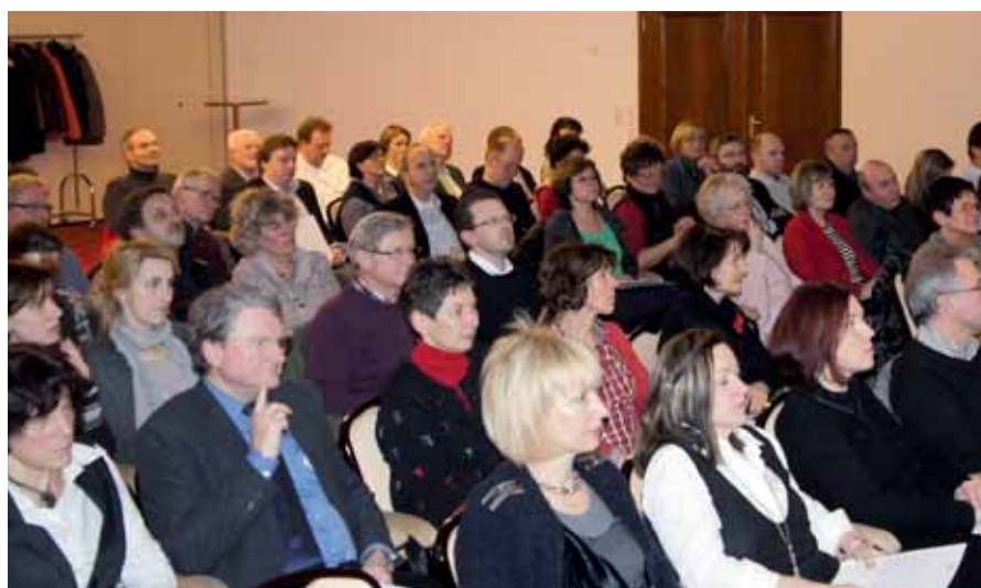
Einmal mehr war der wissenschaftliche Abend der MGZMK gut besucht.