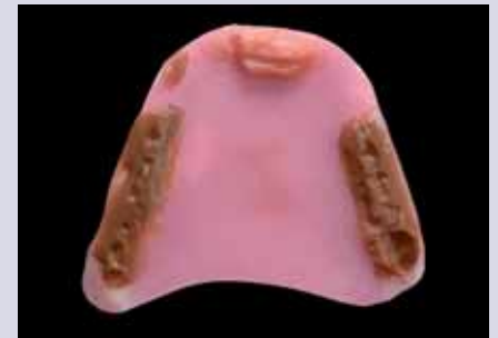
Abb. 22 – 24: Zentrikregistrat aus Hartwachs mit Silikon, sowie aus lichthärtendem Laborkunststoff mit Temp Bond und Aluwachs

die Registrierschablone anschließend auf den Kiefer aufgeschraubt werden. Dabei ist darauf zu achten, dass die Schablone nicht durch verschiedene Anzugsmomente auf der kontralateralen Seite wieder von der Schleimhaut ablöst wird, sondern immer noch ruhig aufliegt. Aber auch vorgefertigte Kunststoffzapfen dienen der Verankerung im Implantat.