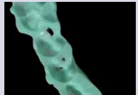
Abb. 6 – 8: Wachsregistrat; Silikonre- gistrat vor und nach Zurückschneiden schwer zu reponierender Bereiche