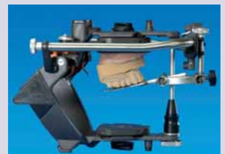
Abb. 25: Arbiträrer Gesichtsbogen mit einartikuliertem Oberkiefermodell

bei physiologischer Kondylus-Diskus-Relation und physiologischer Belastung der beteiligten Gewebestrukturen“. Als Behandler steht man vor der Frage, wo diese Position denn nun sei. Letztlich gibt es keine Möglichkeit, in das Kiefergelenk hineinzuschauen. Diese Unsicherheit spiegelt sich auch in der nicht immer exakt reproduzierbaren Position wieder, in der schließlich beide Kiefer verschlüsselt werden.