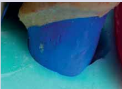
Abb. 11 – 13: Zurückgeschnittenes Teilregistrar mit Kontrolle der Passung auf dem Meistermodell

nitive Arbeit jedoch nicht verwendet werden. Muss ein Zwischenbiss genommen werden, bieten A-Silikone mit einer hohen Shore A-Härte gute physikalische Eigenschaften zur Sicherung der Kieferrelation. Nach der Entnahme aus dem Munde des Patienten ist es sehr wichtig, Abformungen tiefer Fissuren, interdentaler Einziehungen und unter sich gehender Bereichen rigoros zurückzuschneiden. Wird dies auch vom Zahntechniker unterlassen, kann das Registrar nicht ruhig auf dem Modell liegen und wird immer federn. Auch Kunststoffe kommen als Materialien für Checkbisse in Frage. Dabei sind konventionelle Kaltpolymerisate von lichterhärtenden Composites zu unterscheiden. Vorteile sind hier in der einfacheren Fräsbarkeit zu sehen. Bei Kaltpolymerisaten ist darauf zu achten, dass sie für die intraorale Anwendung zugelassen sind. Gipsschlüssel sollten nicht mehr verwendet werden.