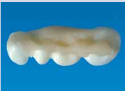
Abb. 14 und 15: Zirkoniumdioxid-Brückengerüst ohne und mit Nachregistrierung