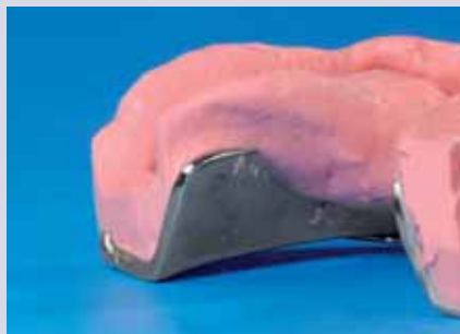
Abb. 1 – 3: Über die Löffelfassung hinaus- quellende Abformmasse kann bei der Lagerung zu Ablösungen und Verzie- hungen führen. Das Zurückschneiden des Materials sichert die Dimensionssta- bilität.