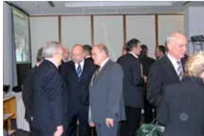
Die Gäste im Gespräch