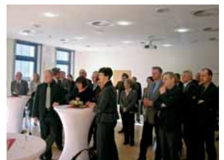
Vertreter der Zahnärzteschaft, ihrer Vertragspartner und der Politik beim Neujahrsempfang.