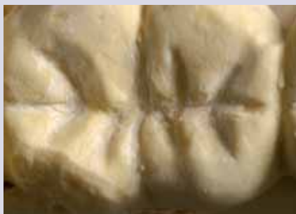
Abb. 4 und 5: Molar eines Gegenkiefers vor und nach Radierung der Gipsperlen.