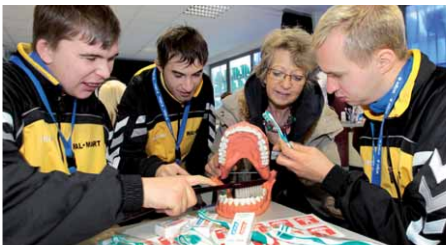
Wie putzt man Zähne richtig? Professionelle Anleitung für die Teilnehmer der Special Olympics-Langlauf-tage in Oberhof

An den Wettbewerben in Oberhof beteiligten sich nach Angaben der Organisatoren rund 160 Sportler aus Thüringen, Sachsen, Baden-Württemberg, Italien, Slowenien und Luxemburg. Die Special Olympics sind eine vom Internationalen Olympischen Komitee (IOC) offiziell anerkannte und in mehr als 170 Ländern vertretene Sportbewegung für Menschen mit geistiger und mehrfacher Behinderung. Seit 2004 verfügen die Special Olympics über ein eigenes Gesundheitsprogramm, das durch das ehrenamtliche Engagement von Ärzten und medizinischem Fachpersonal getragen wird.