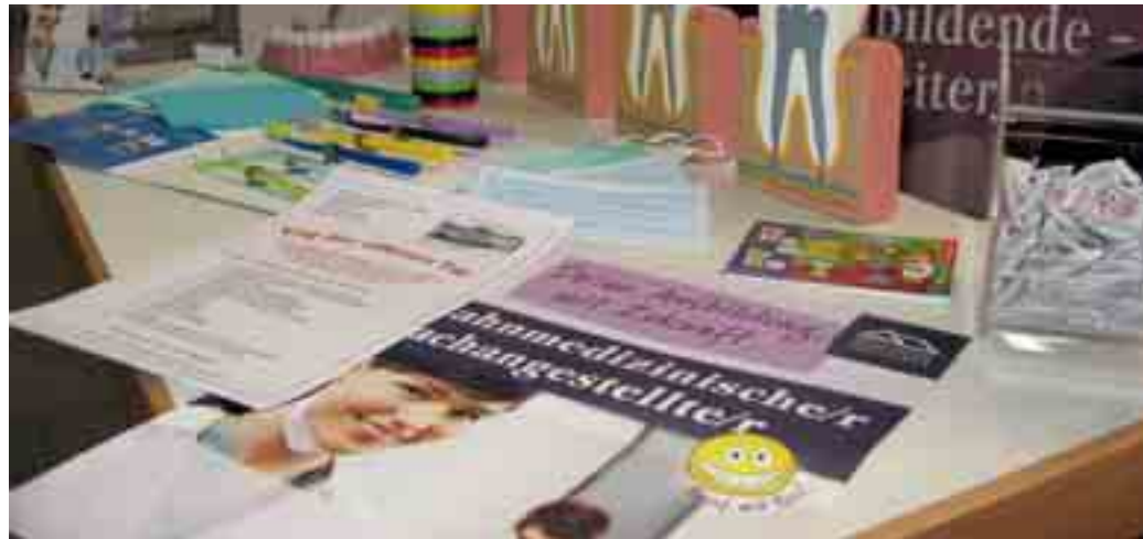
Materialien zur Ausbildungswerbung

Hilfreich ist aber auch das Werben im privaten Umfeld, in bekannten Schulen, in Zeitungsannoncen, die Nachfrage bei der Arbeitsagentur oder