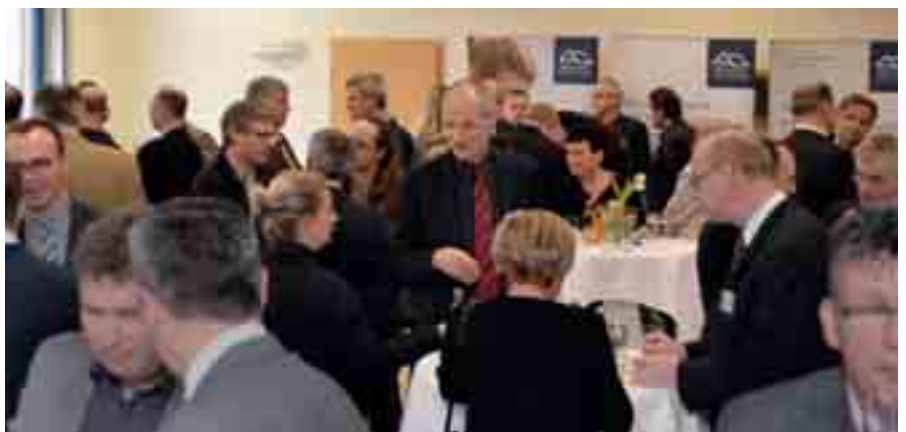
Mehr als 100 Gäste kamen zum Neujahrsempfang.