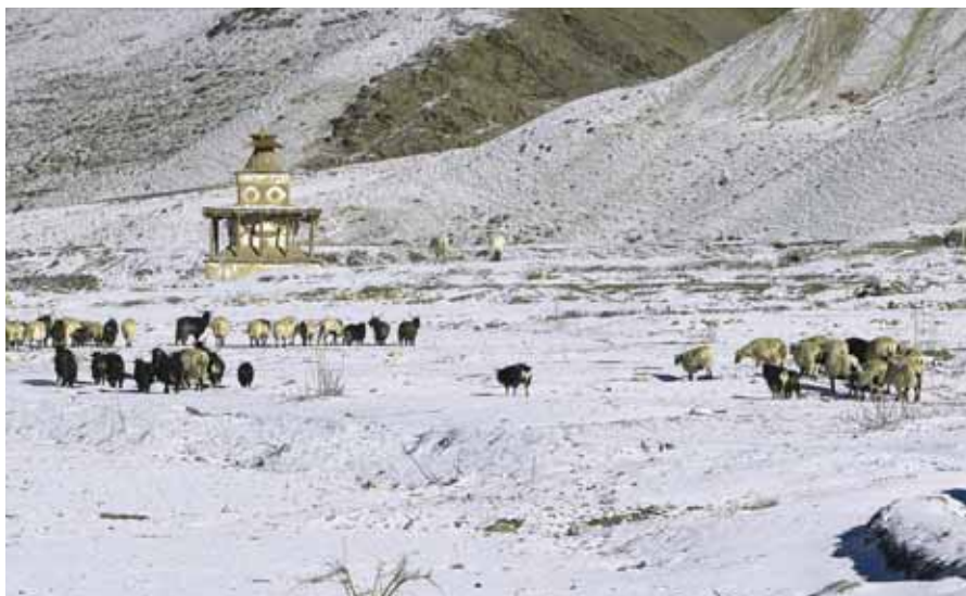
Weidewirtschaft auf der Hochebene bei 4000–4500 Metern üNN

In Dolpa siedeln Buddhisten und Bön-Gemeinschaften, die letzten Anhänger der animistisch-magischen ursprünglichen Religion Tibets, die bei unserer Ankunft damit beschäftigt waren, sich auf Lhosar, das Neujahrsfest des tibetischen Kalenders, vorzubereiten. Ob nun – wie bei uns – der letzte Tag des alten Jahres genutzt wird, um die noch nicht erfüllten Vorsätze anzugehen oder ob es als glücksverheißend gilt, gesäubert das neue Jahr zu erreichen: in allen Siedlungen entlang des Dho-Tarap wurde schon am frühen Morgen die Eisdecke des Flusses von Männern aufgeschlagen, von Kindern Brennholz herangetragen, mit dem die Frauen das Flusswasser erhitzen und darin vermutlich den gesamten Hausstand, von Kleidungsstücken über Bettdecken bis zu Teppichen, durchwuschen. Über die Trocknung der Wäsche brauchte man