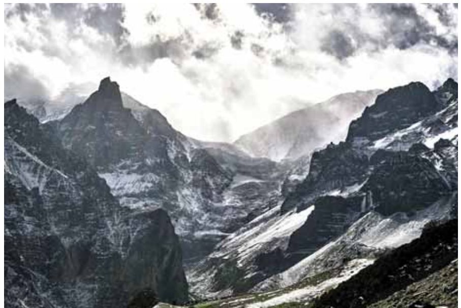
Der kurze Weg nach Jena

IBAN: DE85 8208 0000 0344 9130 00 BIC: DRESDEFF827