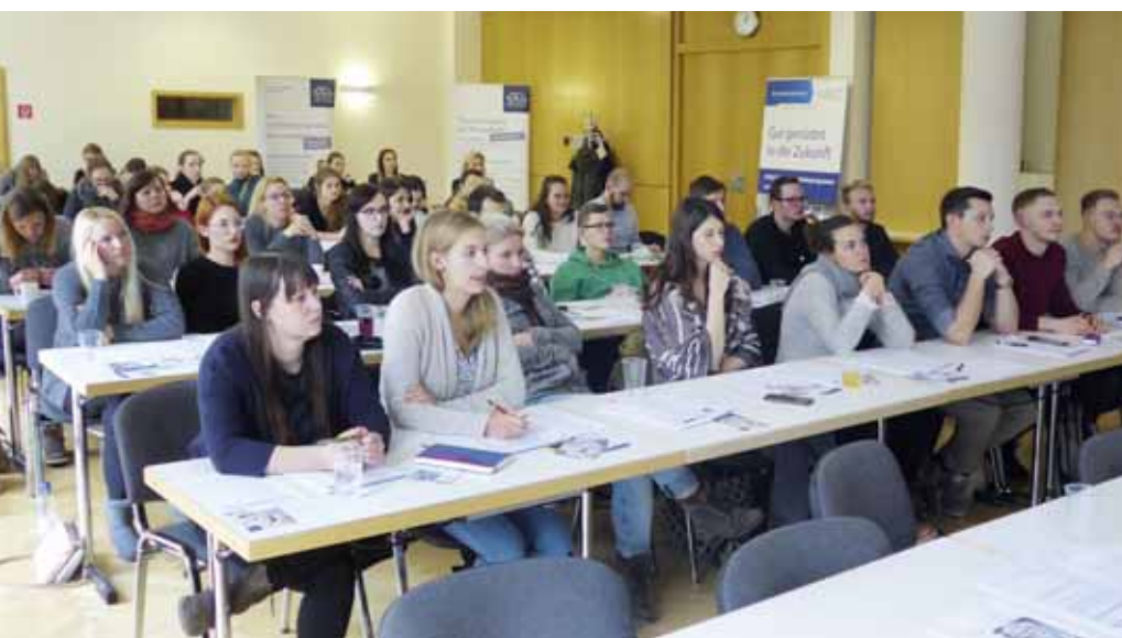
48 Jenaer Zahnmedizin-Studenten des fünften Studienjahres waren am 14. Dezember 2018 beim Berufskundetag in der Landeszahnärztekammer zu Gast.

Wir werden den gemeinsamen Berufskundetag fortwährend als Chance sehen. Wir freuen uns, diesen Tag auch im Jahr 2019 mit weiteren Ideen, guter kollegialer Zusammenarbeit und reger Teilnahme fortzuführen. Für das Engagement beim Berufskundetag im Dezember 2018 bedanken wir uns herzlich bei allen Beteiligten, die sich neben ihrer Arbeit die Zeit für diese wichtige ehrenamtliche Tätigkeit genommen haben.