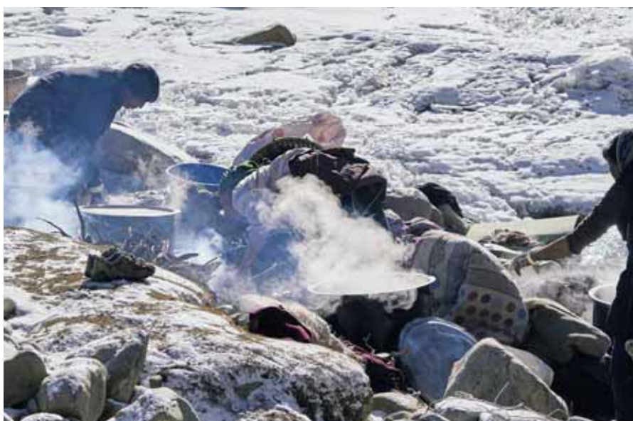
„Große Wäsche“ am vereisten Fluss

sich wohl keine Sorgen zu machen, denn hatte man sie aus den Bottichen genommen, war sie schon gefroren und konnten ohne zu tropfen nach Hause getragen werden.