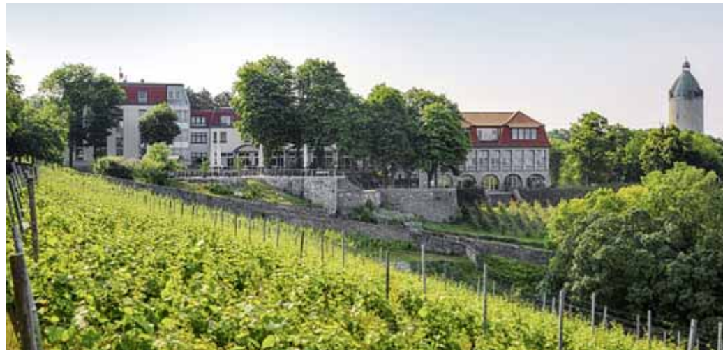
Das Weinberghotel Edelacker in Freyburg/Unstrut beherbergt im Oktober 2019 die erste Zahnmedizinische Herbstlese der Fortbildungsakademie „Adolph Witzel“.

Den Blick noch etwas weiter voran gerichtet konzipieren wir derzeit für März 2020