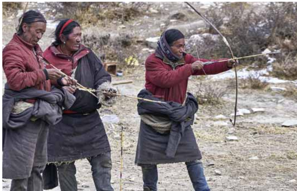
Der Pfeil trifft das Ziel, doch das Glück liegt im Schützen.