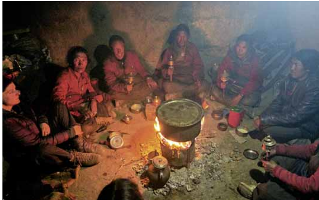
Neujahrsparty im Bön-Kloster. Konversation erfolgt vorwiegend durch die offenen Blicke, auch durch die wenigen englischen Worte, die unsere Gastgeber, die wenigen tibetischen Worte, die wir verstehen. Die Hände stehen für Gesten nur selten zu Verfügung, denn sie werden gebraucht, um unablässig die Gebetsmühlen zu drehen und die mit Chang gefüllten Schalen zum Munde zu führen.

Schwerer werden hier auch unsere Rucksäcke, trotzdem wir ja schon einiges an Nahrungsmitteln, Schokolade und Benzin verbraucht haben. Obwohl es den physikalischen Gesetzmäßig-