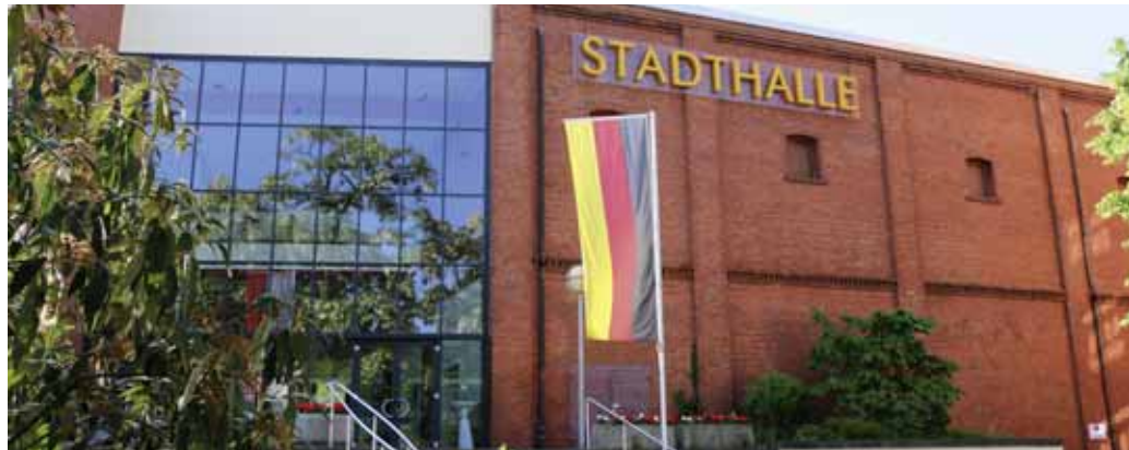
Hotelpark Stadtbrauerei in Arnstadt

Mit dem Anmeldeformular (Vorstands Rundschreiben 2/2019, Anlage 7) können Sie sich und Ihre Angestellten/Mitarbeiter zum 17. Thüringer Vertragszahnärztetag verbindlich anmelden. Die Teilnehmerzahl ist aus Kapazitätsgründen begrenzt und die Anmeldungen werden nach Eingang berücksichtigt.