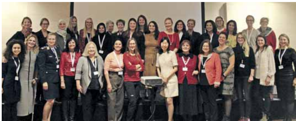
Teilnehmerinnen der 1st Women Dentists' Leadership Conference in Berlin