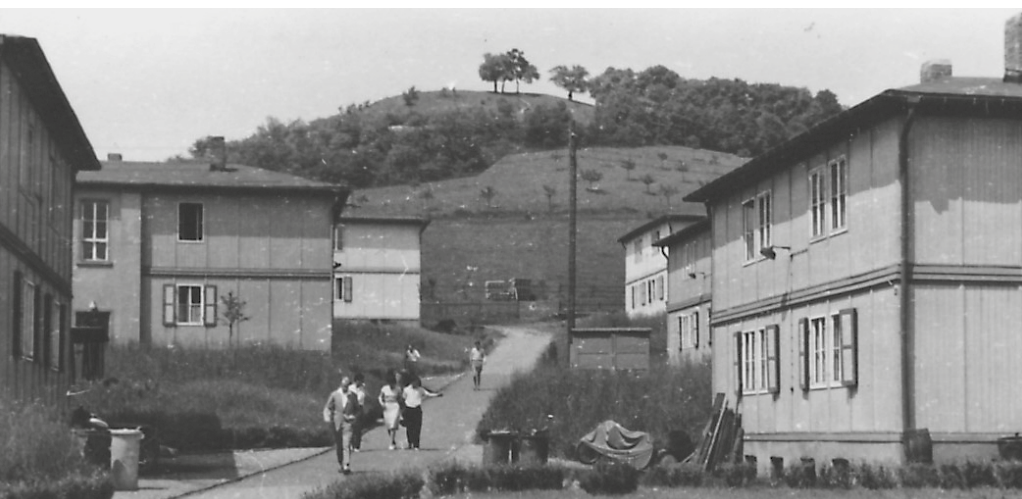
Zu sechst in einem Raum mit Kohlenofen und Doppelstockbetten: Viele Studierende der Zahnmedizin waren in Holzbaracken im Jenaer Ortsteil Zwätzen untergebracht.

Die Straßenbahn sammelte uns am Morgen ein und spuckte uns am Abend wieder aus. Es war nicht viel Zeit für Kultur, für ein Schwätzchen am Abend in der Eckkneipe aber allemal. Einmal saßen wir in Tischnachbarschaft mit sowjetischen Offizieren, als ein Student sich einen Schuh auszog und damit auf den Tisch haute. Da lief einer der Chargen hochrot an, griff nach dem Revolver und wollte den Klopfer nach draußen expedieren. Seine Genossen konnten es verhindern. Hintergrund war der