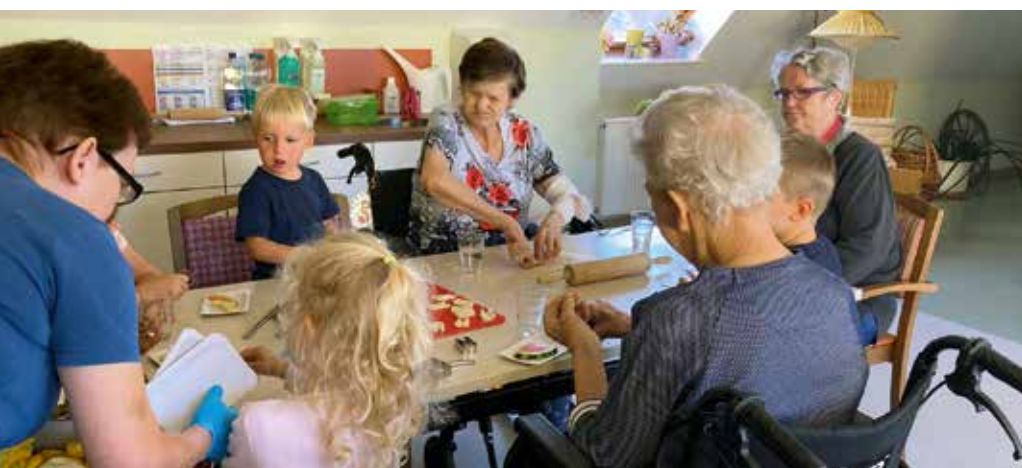
Senioren und Kinder bastelten gemeinsam Zähne aus Salzteig.

Antworten auf Chiffre-Anzeigen senden Sie mit der Chiffre-Nr. auf dem Umschlag an: Werbeagentur Kleine Arche GmbH, Holbeinstr. 73, 99096 Erfurt