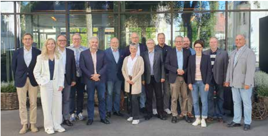
Vorsitzende der Vertreterversammlungen der KZVen

Darüber hinaus wurden jedoch auch die ganz aktuellen Themen wie Lauterbachs Wiedereinführung der Budgetierung, in deren Folge viele Vertreterversammlungen vergütungsbeschränkende Regelungen für das Jahr 2023 beschließen mussten/müssen, und deren finanzielle Folgen für die Kollegenschaft diskutiert. Aufgrund der unglücklicherweise in einigen Bundesländern sehr hohen Bedeutung der Honorarverteilungsmaßstäbe wurde vereinbart, sich beim nächsten Treffen in Bayern intensiv mit der Frage der Diversität und der Besonderheiten verschiedener HVM-Modelle auseinander zu setzen. Weitere Themen waren unter anderem aktuelle Schiedsamtverfahren, die Ausgestaltung der Prüfung der Geschäfts-, Rechnungs- und Betriebsführung in den jeweiligen KZVen nach § 274 SGB V, Baumaßnahmen der Körperschaften in den Ländern und im Bund und vieles mehr.