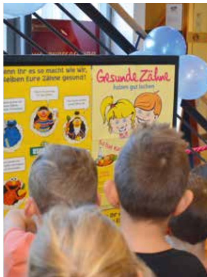
Viele Informationen über gesunde Zähne