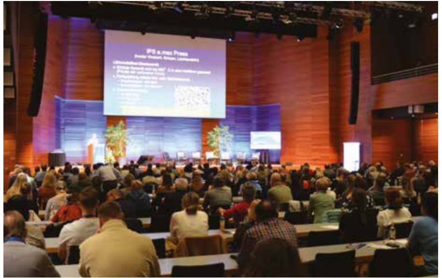
Im zahnärztlichen Vortragsprogramm des Thüringer Zahnärztetages 2026 geben renommierte Referentinnen und Referenten wertvolle Impulse für den Praxisalltag.