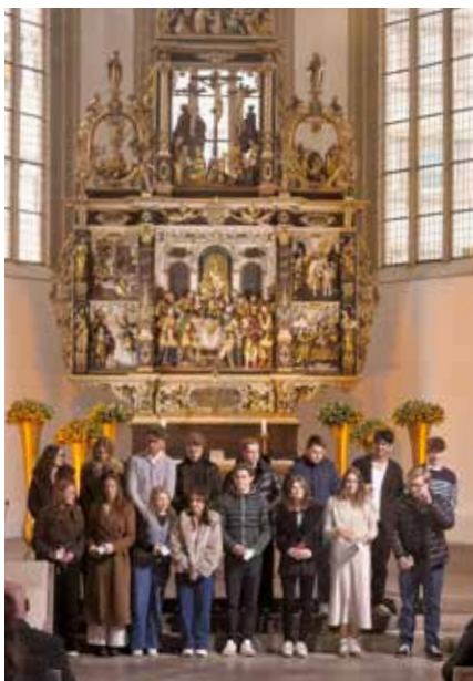
Die ersten Studierenden der Zahnmedizin an der HMU Erfurt wurden in der Erfurter Kaufmannskirche immatrikuliert.