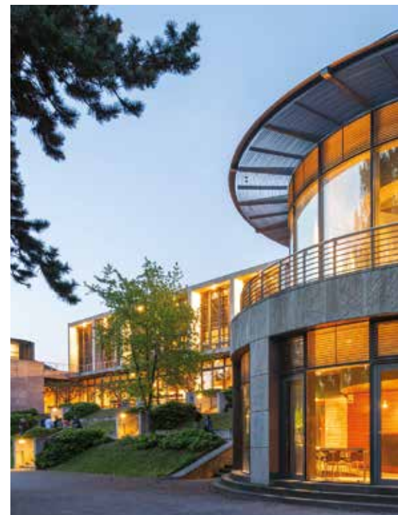
Zum zweiten Mal nach 2024 bietet das Congress Centrum Weimarhalle in Weimar einen inspirierenden Rahmen für den Thüringer Zahnärztetag.

Generell gilt die Maxime „Composite first – Ceramic second“ – nicht weil Komposit per se besser ist, sondern weil jüngere Patienten immer zunächst Komposit als minimalinvasive Variante erhalten. Während klassische Inlays heute praktisch keinen Sinn mehr machen, behalten Keramik-Teilkronen ihren wichtigen Platz in der Zahnerhaltung.