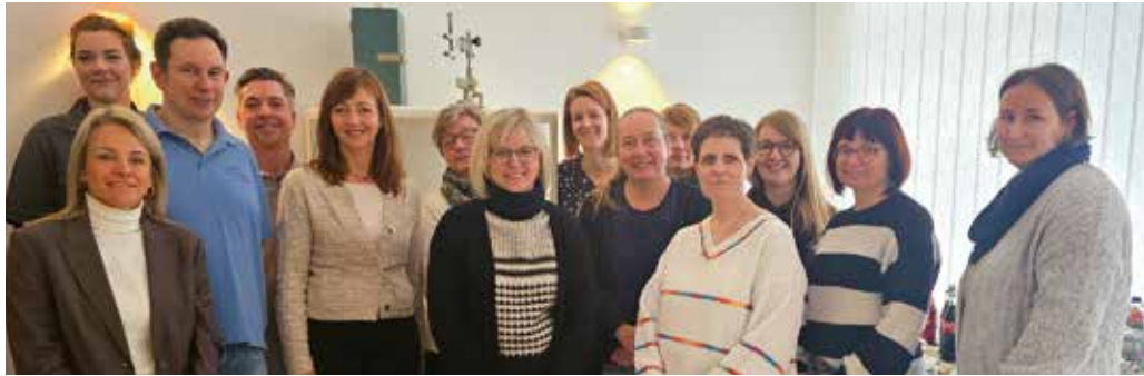
Gelungener Austausch in angenehmer Atmosphäre