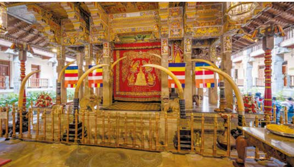
Der goldene Schrein des „Zahntempels“ Sri Dalada Maligawa in Kandy (Sri Lanka) gilt als wichtigstes Heiligtum des Buddhismus im Land. Er ist seit 1988 auch UNESCO-Weltkulturerbe. Hier wird der Überlieferung zufolge ein linker Eckzahn des historischen Religionsstifters Buddha Siddhartha Gautama als Reliquie aufbewahrt. Der Zahn soll nach Buddhas Einäscherung im Jahr 483 v. Chr. aus dessen Asche gerettet worden sein. Heute wird der Zahn einmal pro Woche gereinigt. Ob es sich allerdings tatsächlich um das Original handelt, bleibt fraglich, da mittlerweile wohl mehrere Kopien des Zahnes existieren.

Bleiben wir bei den Beißerchen. Elefanten- und Walrosszähne waren und sind wohl noch immer begehrt, aber der Schutz der Tiere ist wichtiger. In Sri Lanka werden sogar Zähne