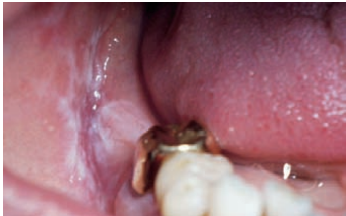
Schleimhautveränderungen bei ausgeprägtem Diabetes