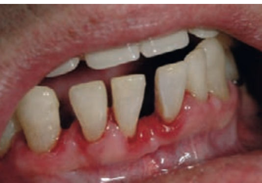
Parodontitis nach Zahnsteinentfernung

Karies eigentlich „out“. Im Erwachsenenalter bestehen die Möglichkeiten der Individualprophylaxe weiter – nun allerdings als private Vorsorge. Dies ist für gesundheitsbewusste Menschen eine Selbstverständlichkeit. Bei falscher bzw. geringer Mundhygiene, einseitiger und/oder qualitativ mangelhafter Ernährung kommt es durch Säuren leicht zur Schwächung der harten Schmelzschicht und somit zum leichteren Einstieg der Karies verursachenden Bakterien in die Zahnhartsubstanz.