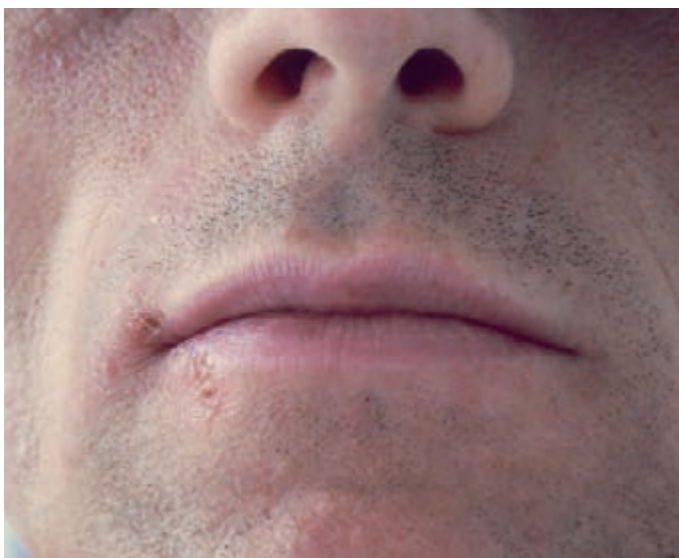
Herpeserkrankung durch Schwächung des Abwehrsystems

Magensäure ist die aggressivste Säure, die der menschliche Körper produziert. Deshalb führt häufiges Erbrechen zur Übersäuerung des Mundes und zum Säureangriff auf die Zähne. Nebenwirkungen von Medikamenten, die die Säurekapazität des Magens neutralisieren, sind im Bereich der Mundhöhle nicht bekannt.