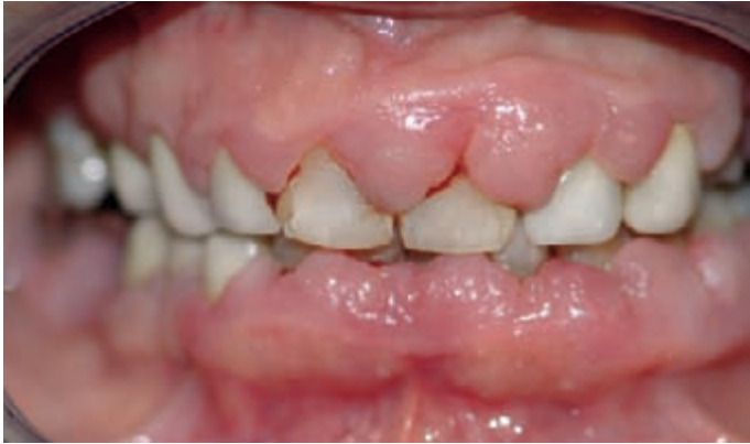
Hyperplasie (Zahnfleischwucherung) durch Hydantoine/Phenytoin