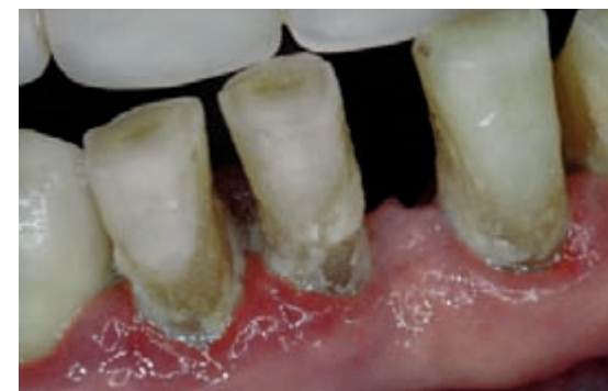
Zahnfleischwucherung durch Amlodipin-Präparate

Er ermöglicht bei Herzklappenerkrankungen heute vielen Menschen mit entsprechenden Medikamenten wieder ein lebenswertes Leben. Diese Patienten haben einen roten Herzpass. Alle zahnärztlich-chirurgischen Behandlungen wie Zahnziehen, Parodontitis-Therapie, aber auch Wurzelbehandlung und oft auch Zahnsteinentfernung erfordern unbedingt eine begleitende Therapie mit einem Antibiotikum. Eine vorherige Beratung mit dem Kardiologen ist angeraten.