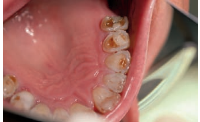
Erosionen durch Rheuma-Medikament (Methotrexat – MTX)

trächtig aber kaum die Arbeit der Nieren. Kritischer wird es bei Tumoren einer oder beider Nieren oder bei Dialyse. Hier ist die zahnärztlich-chirurgische oder parodontologische Behandlung immer mit dem behandelnden Arzt abzustimmen.