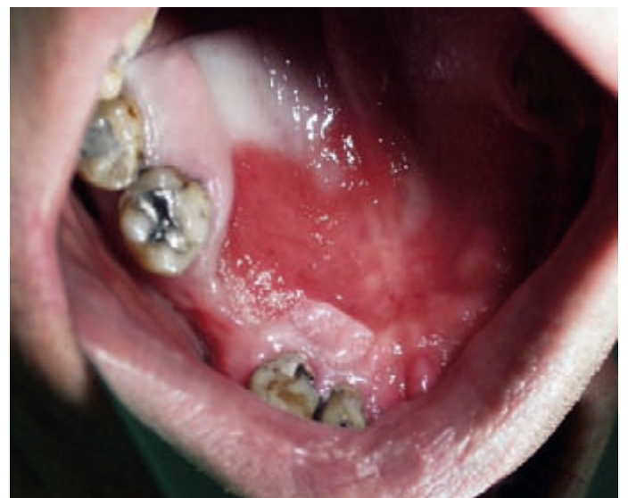
Allergische Reaktion auf Prothesenwerkstoff